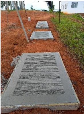
Construcción de andenes de erosión