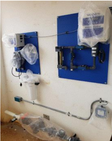
Instalación de clorador