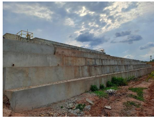
Construcción Muro Desarenador – Control