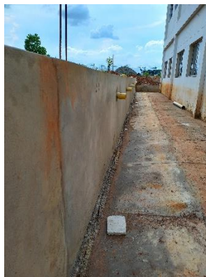
Construcción de cunetas